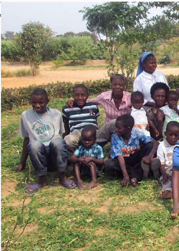
Gebeurtenissen in Kacema Musuma Children's Home 2014 tot heden... Z.O.Z.